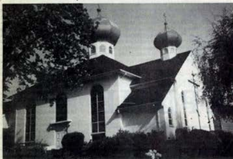
Свято-Диоскорийская церковь в Ванкувере, при которой действует группа милосердия