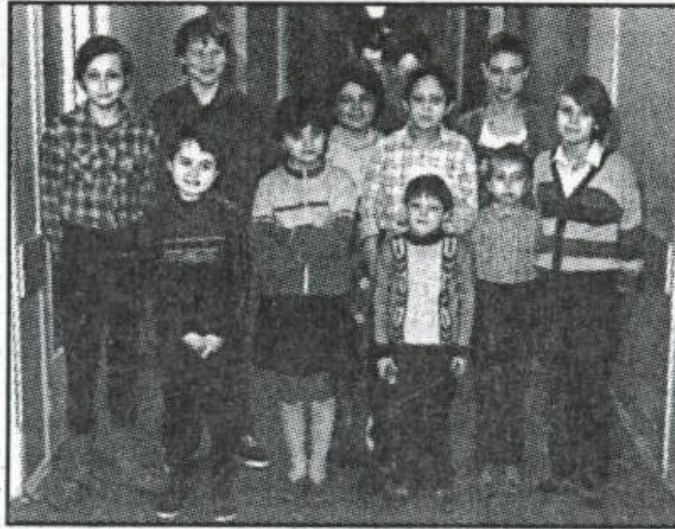
Children at Central Moscow Children's Hospital.